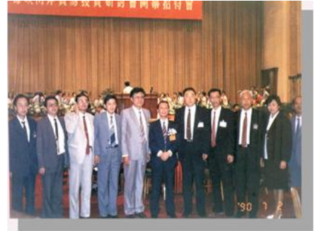
“海峽兩岸貿易投資研討會”開幕招待會前部分代表合影留念