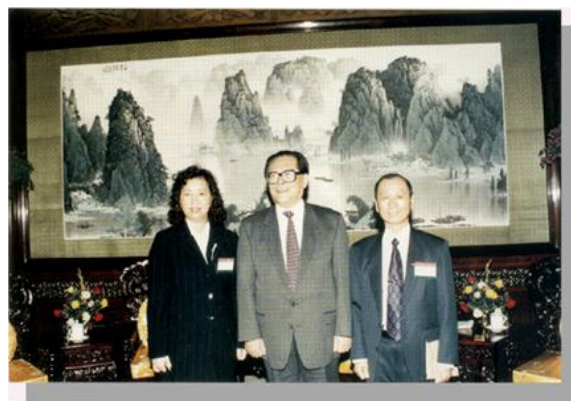
1994年10月11日張平沼會長伉儷拜會江澤民主席 於中南海時之合影