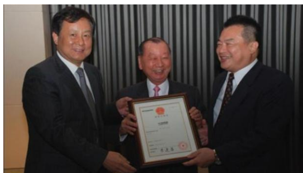
2009年台灣啤酒商標獲大陸登記註冊，大陸工商總局付雙建副總局長(左)、張平沼會長(中)台灣菸酒公司韋伯韜董事長(右)一同合影。

【兩岸商標論壇】自 2006 年雙方協議合作以來，已陸續於廈門、臺北、成都、貴州、無錫、內蒙古、平潭舉辦 11 屆商標論壇。回顧海峽兩岸商標論壇之舉辦，除進行實務、理論之交流，也為兩岸商標主管機關建立良好的溝通平台，並在 2010 年 6 月簽署「兩岸智慧財產權保護合作協議」開啟新紀元。迄今并順利解決諸多台灣重要商標在大陸遭受爭議之困頓，包括「阿里山」、「日月潭」、「池上」、「古坑」、「燕巢」、「埔里」…等地名遭惡意搶註問題，為「台灣啤酒」、「中華電信」、「永慶房屋」、「池上」、「摩卡 MOCCA」順利取得中國大陸的商標註冊證，及「慈濟」、「美利達自行車」、「寶島眼鏡」、「克麗緹娜化妝品」、「海昌隱形眼鏡」、「億光電子」、「堤維西交通工業」、「法藍瓷」、「震旦行」、「信義房屋仲介」等多件馳名商標，並由大陸商標局做出積極保護行動，使兩岸改善商標搶註作為，從消極註銷轉變成積極、提早防範的行動，成果卓著，備受商界肯定，且將兩岸二會建立之【兩岸商標論壇】是為解決兩岸商標問題之重要平台。