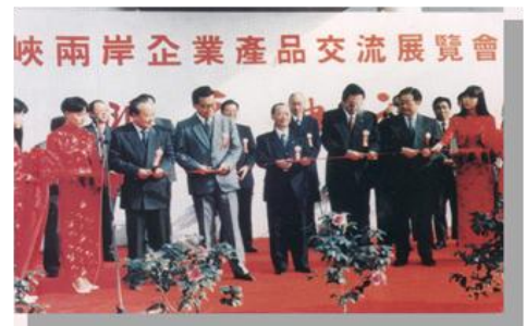
展覽會在北京中國國際展覽會中心舉行剪綵