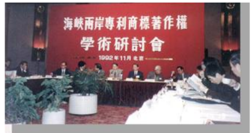
研討會召開之情形