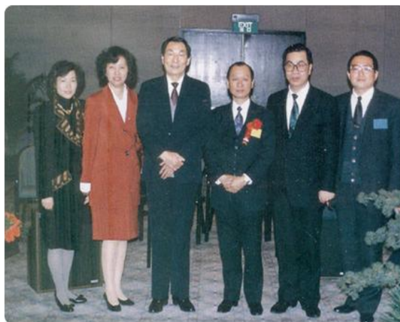
1991年3月張平沼會長伉儷及台商界人士與 朱鎔基先生在上海之合影